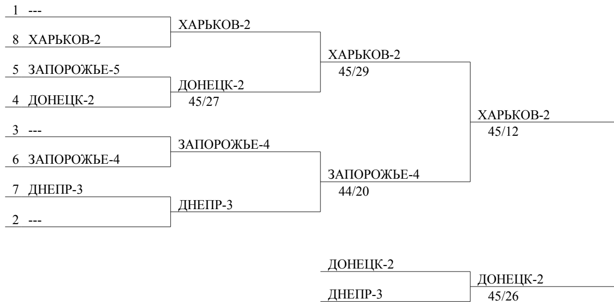
Tableau 9-16 de 8