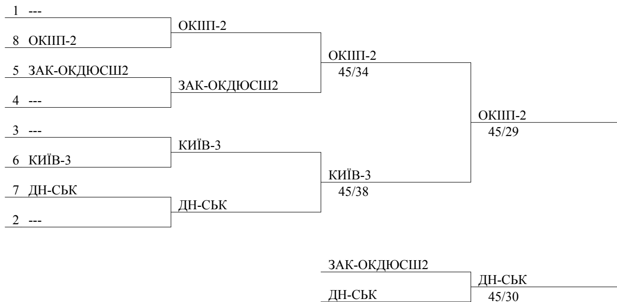
Tableau 9-16 de 8